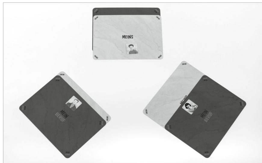
Abb. 5: FIB-FAMILIE IN BALANCE: Work-Life-Balance? - Spielsituation

Und wie geht es den Eltern? Welchen Raum geben sie ihrem Berufs- und ihrem Privatleben? Jedes Familienmitglied kann zeigen, wie MEINS und MEIN BERUF neben-, unter- oder übereinander liegen. Welche Ähnlichkeiten und Unterschiede gibt es zwischen den Familienmitgliedern? Ggf. lassen sich auch noch die Work-Life-Balance einer nicht anwesenden Schwester oder der Großeltern anschaulich demonstrieren. Angenommen jeder könnte seine Räume MEINS und MEIN BERUF selbst bestimmen: wie viel Raum bekämen