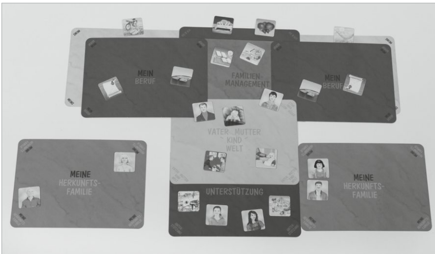
Abb.1: FIB_FAMILIE IN BALANCE: „Wege aus der Erschöpfung“ - Spielsituation

und Arbeitsmaterial, das Eltern dazu anregt, ihre Einflussmöglichkeiten auf ihre Lebensgestaltung zu visualisieren und im kommunikativen Austausch zu erweitern.